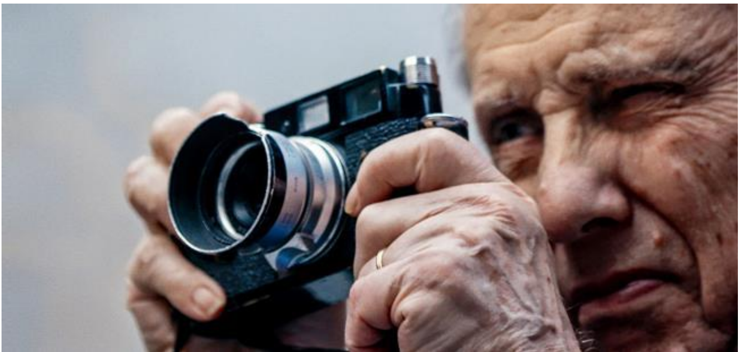
Henri Dauman en 2018

Henri Dauman's qualities - bilingual, enthusiastic, and with a personal style - were widely appreciated. Magazine editors who praised his subtle and efficient sense of composition, his close relationships with his subjects and his sense of narration entrusted him with many covers and colour series.