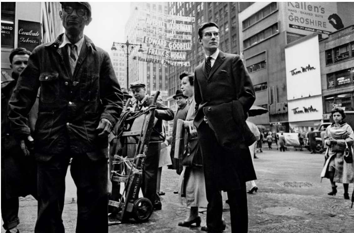
Yves Saint Laurent sur la 7 ème Avenue /1958

His portraits of women (Jane Fonda, Brigitte Bardot, Jean Seberg, Marilyn Monroe) are filled with a particular tenderness : the viewer is alone with them. This feeling of closeness also transpires, rather unexpectedly, from his photos of male figures such as Jean-Luc Godard, Eugene Ionesco, Elvis Presley or Alain Delon.