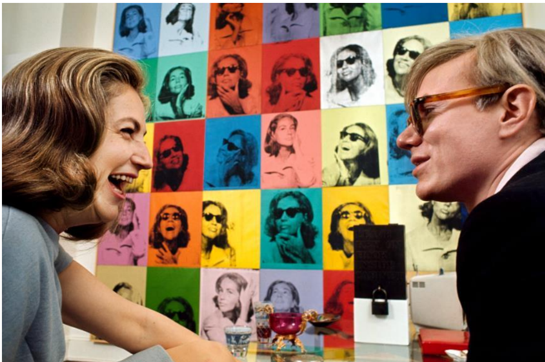
Living with Pop Art - Ethel Scull & Andy Warhol / 1965

The layout of the magazines often echoed the efficiency of American films. This particular style is more than a homage: it is a response to the growing competition of emerging media.