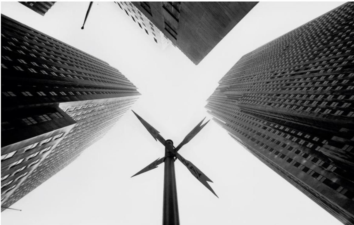
New York Looking Up – The Rockefeller Center / 1960

Settling in the Upper West Side, he captured the neighbourhood's casual and uninhibited spirit in his photographs. In the Bronx, he depicted a completely different world, with « The Savage Nomads Gang » (1977), picturing rebellious youth inventing their own codes.