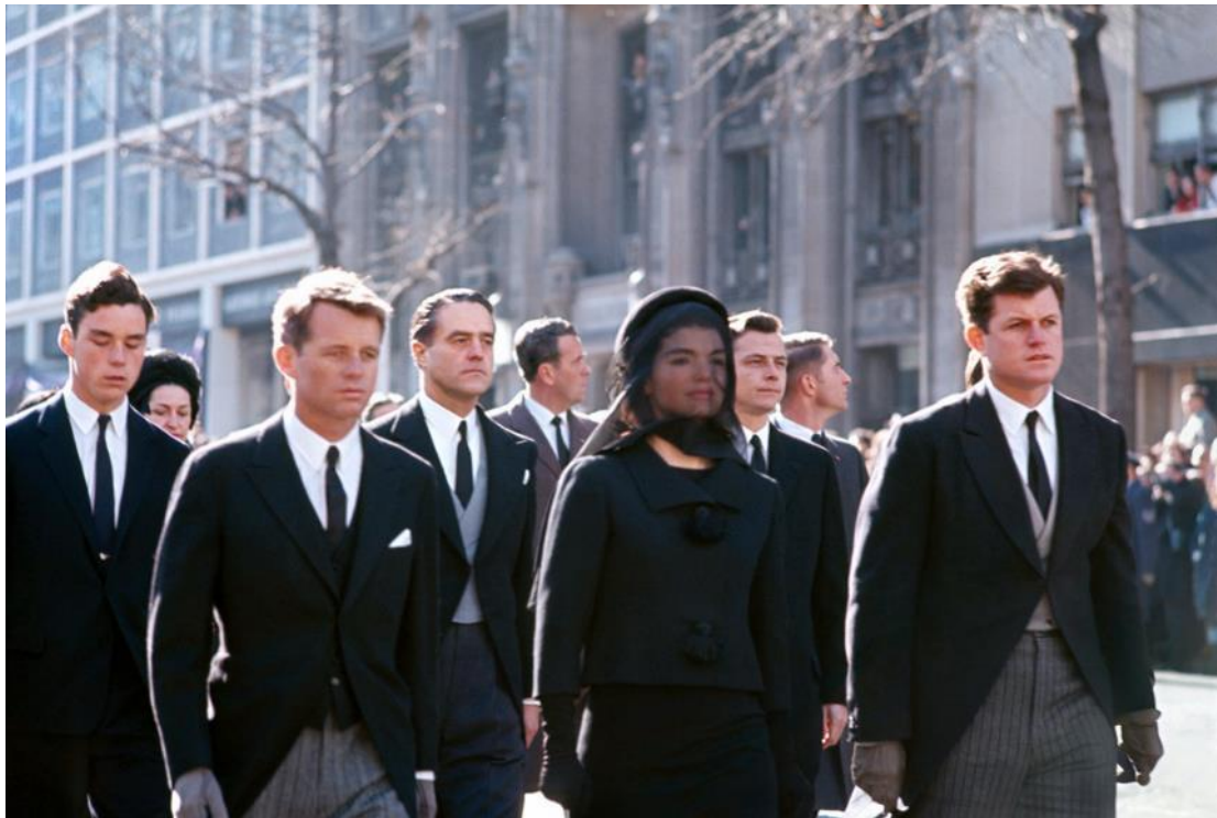
Funérailles de John Kennedy. Jacqueline, Robert et Edward Kennedy 25 novembre 1963